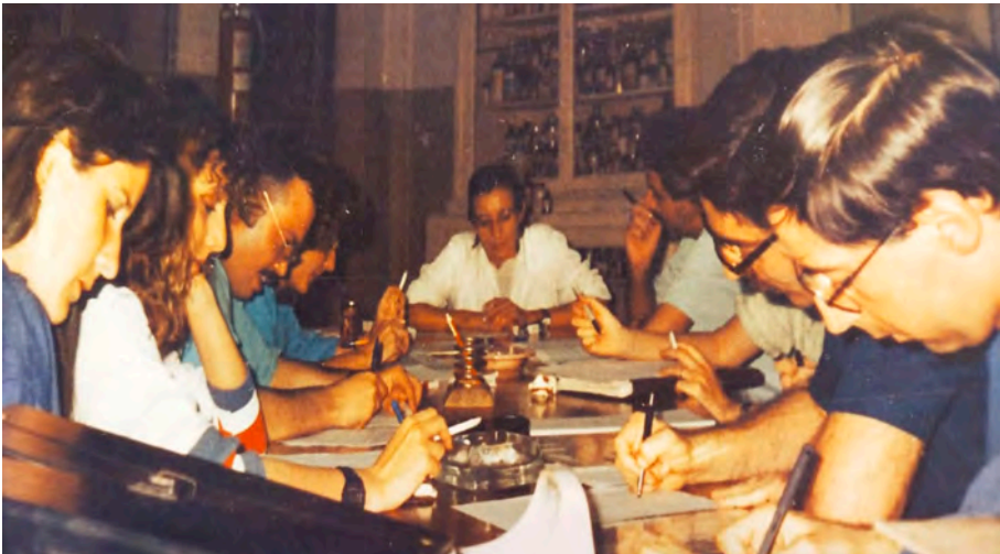
Reunión formativa con sus alumnos de cara a la preparación de la oposición de médico forense.

Sus primeras ocupaciones, antes de trabajar como forense, fueron en el ámbito de la Medicina Clínica. Realizó sustituciones en el centro de salud del municipio de Albal (l'Horta Sud). Su padre fue uno de sus mentores en el ámbito forense, enseñándole buena parte de lo que hoy en día sabe de esta profesión, y consideraba que un buen profesional que deseara dedicarse al campo de la Medicina Forense tiene que aprender el trabajo práctico de esta rama de la Medicina. De hecho, con la edad de 18 años, le acompañaba a realizar autopsias, aunque a su padre en un principio no le gustaba mucho la idea de que su hija se dedicase a este campo.