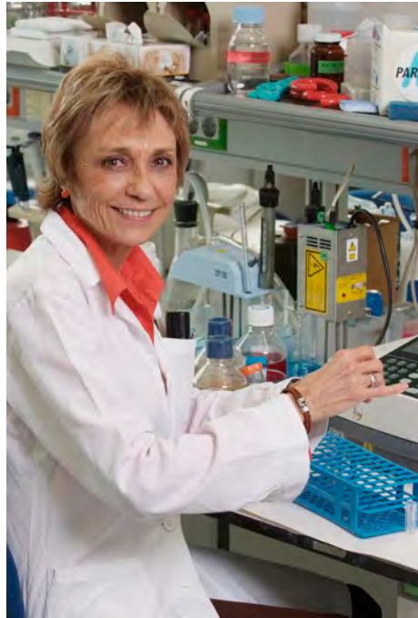
Pionera y referente internacional sobre el estudio del síndrome alcohólico fetal.

A partir de 2005 deja el Instituto de Investigaciones Citológicas y se incorpora, hasta la actualidad, al Centro de Investigación Príncipe Felipe donde es la jefa del Laboratorio de Patología Celular y Molecular. Antes de que se comenzarán a realizar los primeros estudios sobre los efectos del alcohol en adolescentes en España (2005-2006), ya había estado investigando sobre los efectos nocivos que produce el alcohol en adolescentes con un consumo de binge drinking o botellón durante los fines de semana. Para este periodo vital señalaba que el cerebro del adolescente está en fase de desarrollo, ya que existen dos zonas cerebrales (corteza cerebral e hipocampo), que no han completado su completo desarrollo. Por tanto, al consumir altas cantidades de alcohol durante un breve periodo de tiempo (botellón) los fines de semana, conduce a bajo rendimiento escolar y alteraciones en la conducta del adolescente. Además, los efectos que causa el alcohol en el cerebro adolescente son irreversibles y conducen a una predisposición del consumo de alcohol en el individuo adulto. Este modelo, ha sido reproducido y copiado por muchos grupos de investigación a nivel internacional.