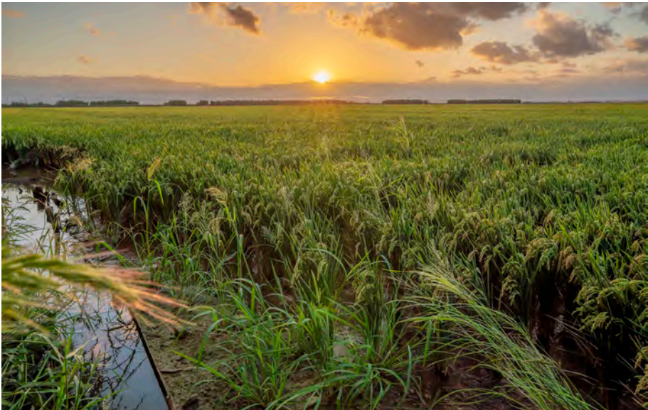
El Mareny de Barraquetes: el seu lloc al món.

Nació en el Mareny de Barraquetes (Sueca) a orillas de la marjal de la Albufera en 1949. Era la tercera de cinco hermanos de una familia, valencianohablante, muy arraigada y querida en el municipio. Sus yayos tenían una tienda y sus padres continuaron con el negocio familiar. Guarda muy buenos recuerdos de su infancia y juventud. Ahora bien, su padre murió cuando ella tenía 12 años y esto hizo que los hijos tuvieran