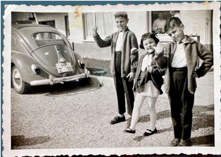
Visita a sus padres en Mannheim (Alemania) en 1964.