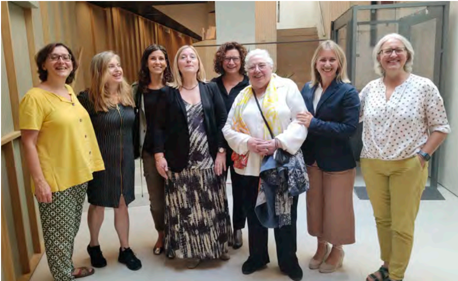
Psiquiatra polifacética, es estimada, valorada y respetada.

El profesional que ejerce la Psiquiatría no solo ofrece el tratamiento farmacológico o psiquiátrico a aquellas personas que tienen trastornos mentales u otras patologías, sino también brinda la oportunidad de educar a la población en temas relacionados con la prevención de determinadas sustancias dañinas para su salud, ofreciéndoles otras alternativas distintas a las que se puede dedicar en su tiempo libre. Además de enseñarles que pueden ser felices y disfrutar la vida sin drogas. La educación para la Salud es imprescindible y en nuestro país se hace poco hincapié en ello, a pesar de que se ha comprobado que una buena educación para la salud, disminuye el número de enfermedades. Es necesario educar a tener hábitos de vida saludables, pero con cuidado en ocasiones. Por ejemplo, la adicción al gimnasio es tan nefasta como la vida sedentaria, o la ortorexia es igual de grave que el consumo de grasas.