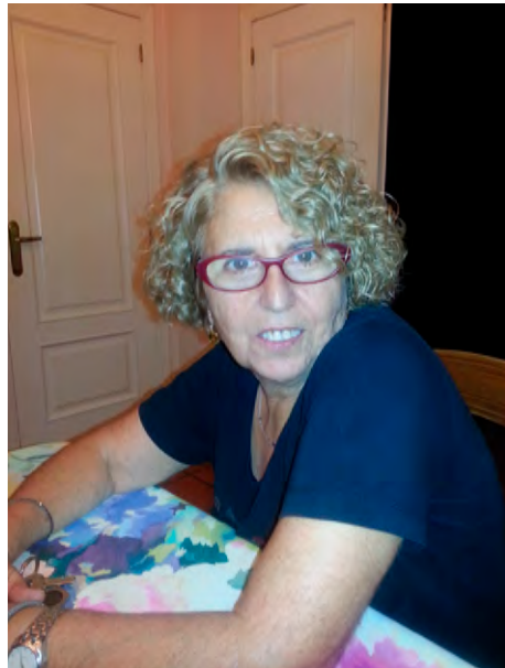
Humildad, modestia y compromiso con los más desfavorecidos.

En su opinión la formación resultaba fundamental razón por la cual siempre procuró ir a todos los cursos de formación continua que se ofertaban. Así cursó, entre otros, los siguien-