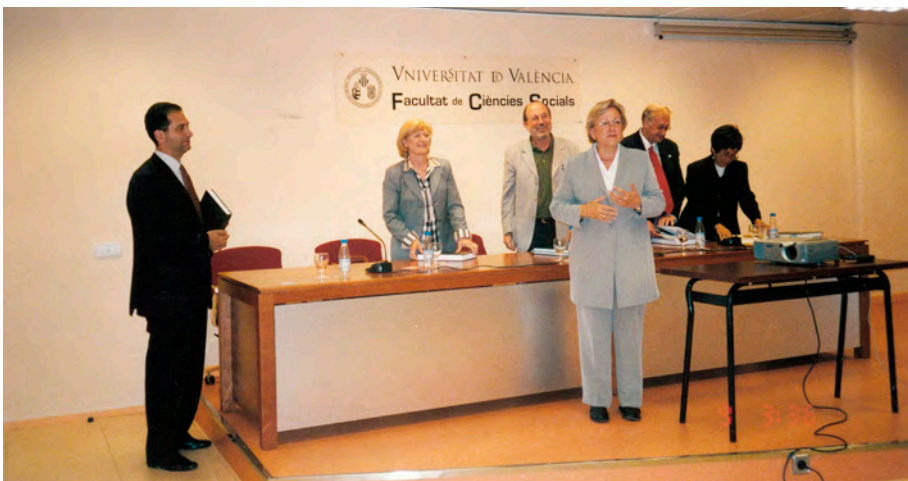
La defensa de su tesis doctoral marcó un antes y un después en el estudio del alcoholismo femenino.