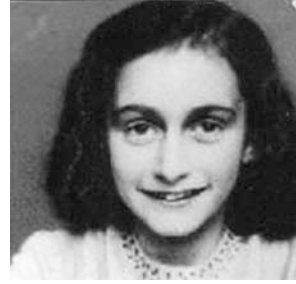
Ana Frank, Diario

Para ser más clara tendré que añadir una explicación, porque nadie entenderá cómo una chica de trece años puede estar sola en el mundo. Es que tampoco es tan así: tengo unos padres muy buenos y una hermana de dieciséis, y tengo como treinta amigas en total, entre buenas y menos buenas. Tengo un montón de admiradores que tratan de que nuestras miradas se crucen o que, cuando no hay otra posibilidad, intentan mirarme durante la clase a través de un espejito roto. Tengo a mis parientes, a mis tías, que son muy buenas, y un buen hogar. Al parecer no me falta nada, salvo la amiga del alma. Con las chicas que conozco lo único que puedo hacer es divertirme y pasarlo bien. Nunca hablamos de otras cosas que no sean las cotidianas, nunca llegamos a hablar de cosas íntimas. Y ahí está justamente el quid de la cuestión. Tal vez la falta de confidencialidad sea culpa mía, el asunto es que las cosas son como son y lamentablemente no se pueden cambiar. De ahí este diario.